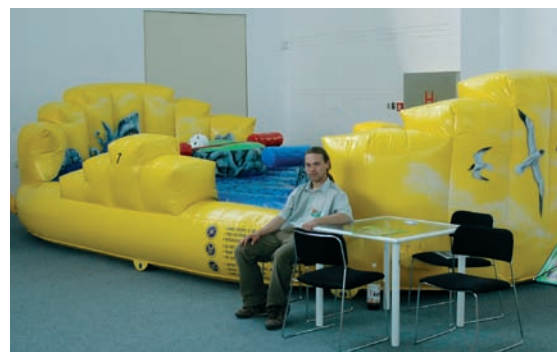
stánek společnosti COVER