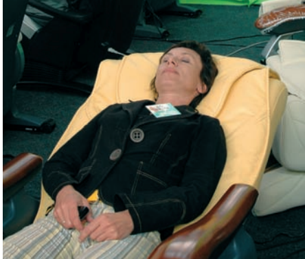
Odpočinek po „tvrdé práci“ šéfredaktorky TRHU ZÁBAVY