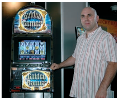
pan Bos - BOS SPIELAUTOMATEN GmbH