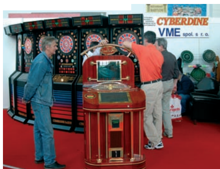
stánek VME (CYBERDINE)