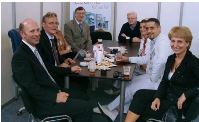
Setkání s kolegy z Polska - SUREXPO a Slovenska SLOVAK SHOW