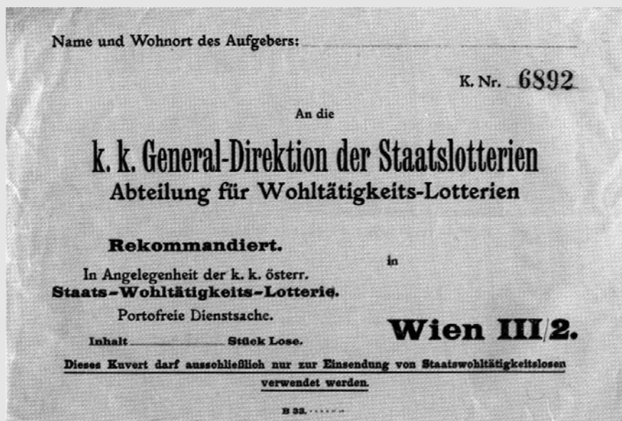
Obálka na losy určená vídeňské centrále

ve Vídni, které ji zpočátku vypisovalo jen ve prospěch civilních dobročinných cílů. Nedostatek finančních prostředků v oblasti vojenství však způsobil tlak na zajištění prostředků i pro složky vojenské. Proto bylo rozhodnuto rozdělit výnosy Státní loterie na účely dobročinné civilní a dobročinné vojenské. Aby bylo dělení snazší, nemuselo se jednat o přesné poloviny a na daný účel