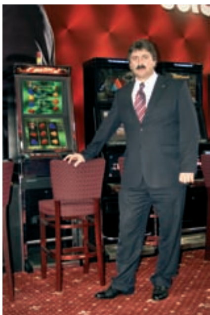
pan Kulajta (BONVER WIN)

Synot IVT a novinku na českém trhu – systém Multi Lottery. Další z novinek představených společností Bonver WIN, a. s. na výstavě „Svět